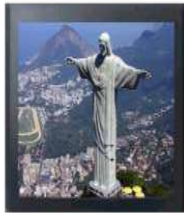
IMAGEM 4:3 COM CROP