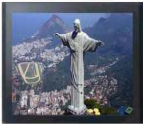
IMAGEM 16:9 ORIGINAL