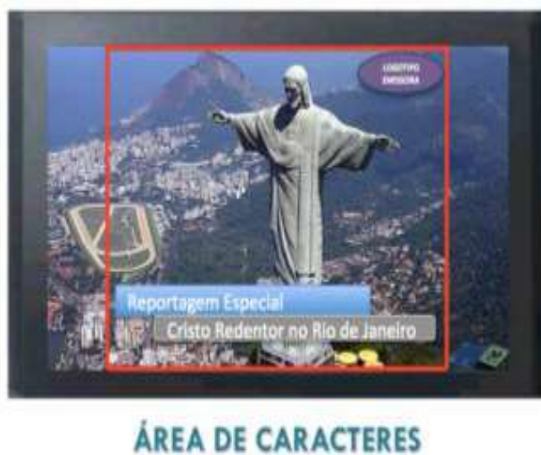
Figura 5: Caracteres dentro da área de segurança 4:3.

9.3.1. O downconversion de HD em 16:9 para SD em 4:3 deve ser feito com Crop : Prever caracteres dentro da área de segurança 4:3 ( safe title area ) no vídeo 16:9 (prever área de Crop lateral ) (ver figura 5).