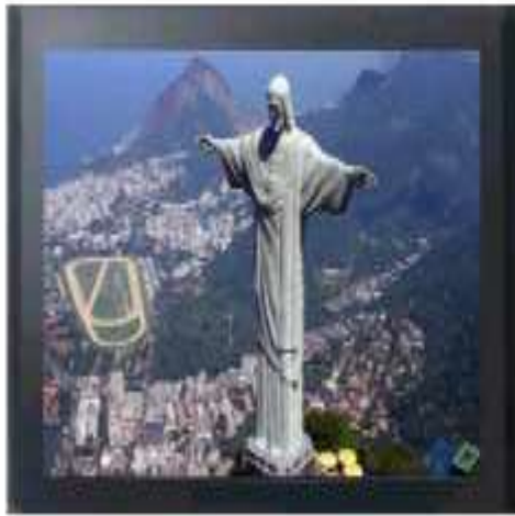
IMAGEM 16:9 ORIGINAL