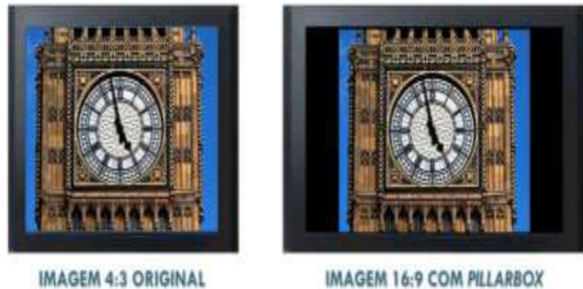
Figura 6: Upconversion Correto : Imagem convertida de 4:3 para 16:9 com Pillarbox .

imagens captados em 4:3. A conversão de imagens de 4:3 para 16:9 deve ser feita adicionando pilares pretos nas laterais chamados pillarbox (ver figuras 6 e 7).