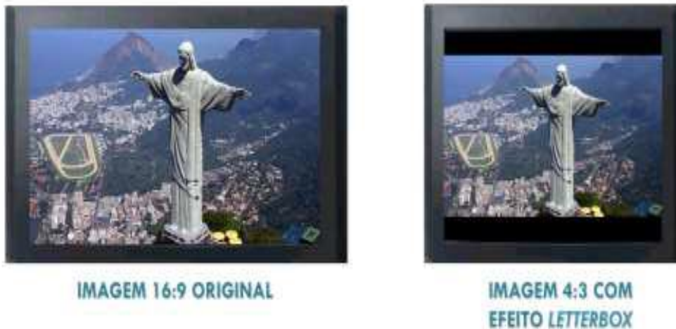
Figura 4: Downconversion Errado: Imagem convertida de 16:9 para 4:3 com Efeito Letterbox .