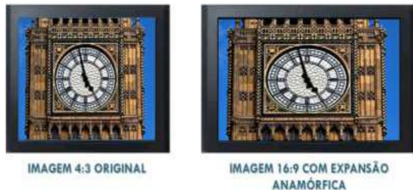
Figura 7: Upconversion Errado : Imagem convertida de 4:3 para 16:9 com Efeito de Expansão Anamórfica ou Efeito de Tela Esticada.