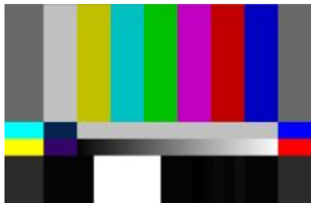
Figura 8: Sinal de COLOR BARS SMPTE em HD.