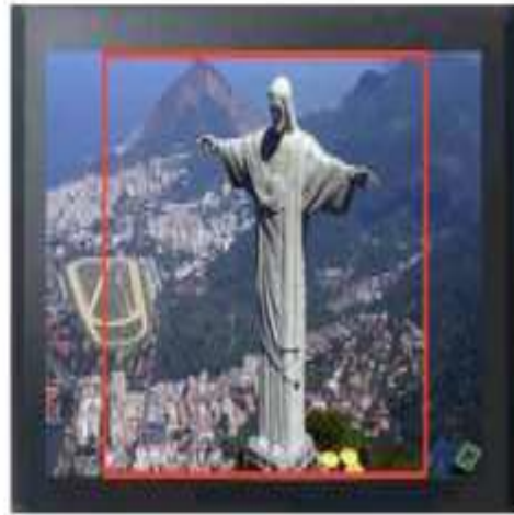
AREA DE SEGURANÇA 4:3